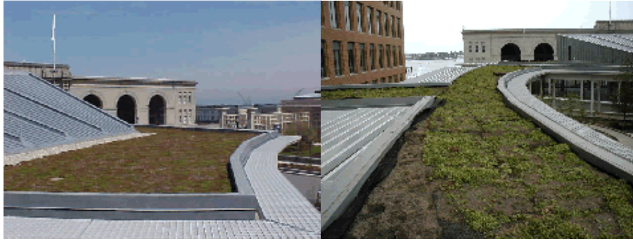
Figura: Ecotelhado para cobertura de prédios.