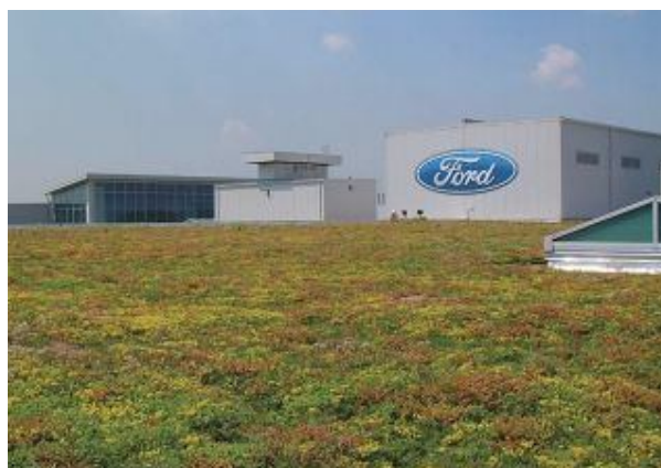
Figura: Ecotelhado para indústrias.

A norma da ISO 14001 determina melhorias constantes quanto a medidas que diminuam o impacto ambiental. O ideal seria que indústrias impactassem positivamente, gerando além de empregos e produtos, mais energia, oxigênio, purificando a água. O Ecotelhado vai de encontro a estas expectativas.