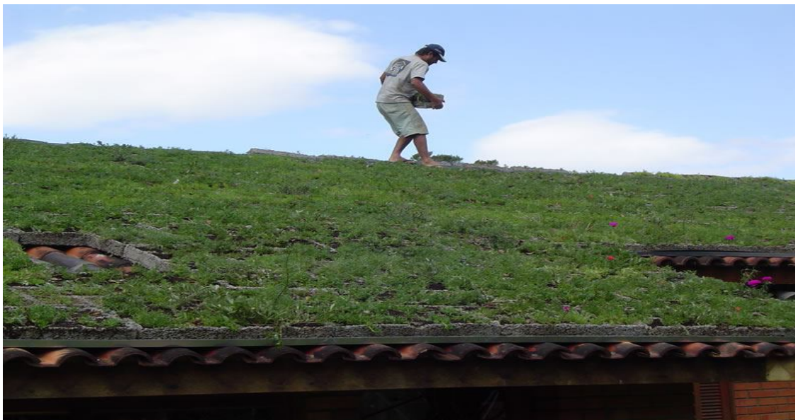
Figura 3: Manutenção do telhado