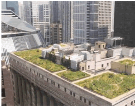
Figura: Ecotelhado para cobertura de prédios. Fonte: Disponível em: < http://www.ecotelhado.com.br/casa.htm >.