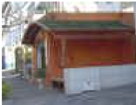
Figura: Ecotelhado para estabelecimentos comerciais.

O ecotelhado proporciona excelente conforto térmico, reduzindo o custo com climatização em escritórios, lojas, restaurantes, repartições públicas e nas escolas. Cria empatia com o consumidor.