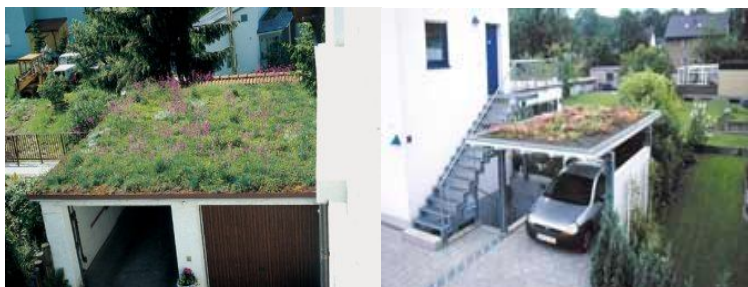
Figura: Ecotelhado para garagens.

Fonte: Disponível em: < http://www.ecotelhado.com.br/casa.htm >.