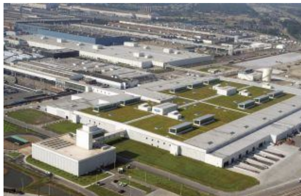
Figura: Ecotelhado para indústrias.