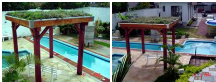
Figura: Ecotelhado para quiosques.