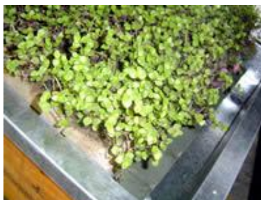
Figura 10: Vista da calha de chapa galvanizada