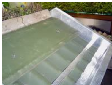
Figura 12: Montagem da calha e colocação da capa sobre o espelho de madeira. Fonte: Disponível em: < http://www.ecotelhado.com.br/montagem.htm >.