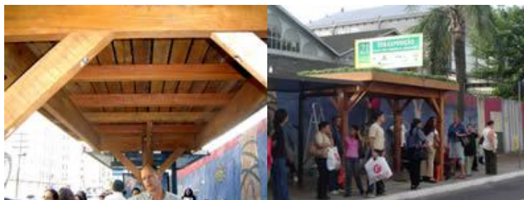
Figura: Ecotelhado em parada de ônibus.