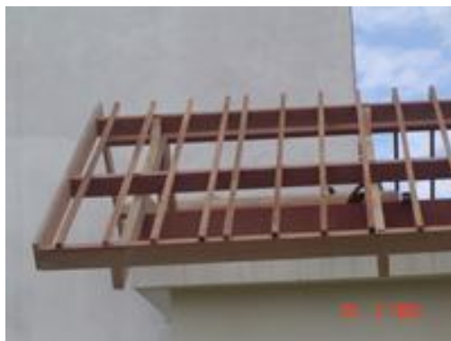
Figura 6: Montagem do telhado