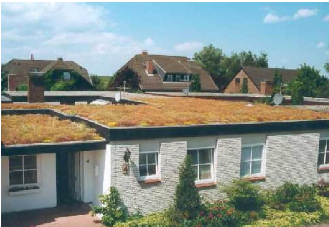
Figura 4: Telhado vivo extensivo em edificação alemã