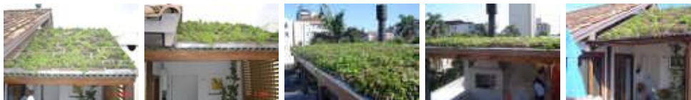
Figura: Ecotelhado para churrasqueiras.