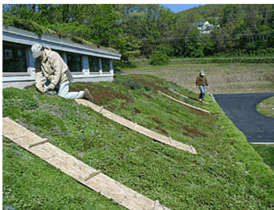
Figura 5: Manutenção atual.