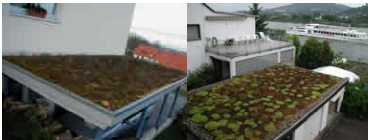
Figura: Ecotelhado para garagens.

O Ecotelhado pode ser aplicado em garagens com um resultado harmonioso. Veja algumas fotos de Ecotelhado para cobertura de garagens clique nas fotos para ampliá-las