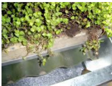
Figura 11: captação de água