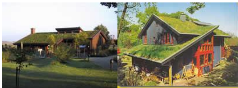
Figura: Ecotelhado para casas.

Nos últimos anos, o ideal de sustentabilidade tem avançado consideravelmente. Telhados vegetados, quando bem construídos, representam uma consistente resposta a esta exigência. Nada mais justo, sob o ponto de vista ecológico, que ao se construir uma casa sobre um solo vegetado, se devolva ao ambiente esta camada de cobertura vegetal, só que agora, na forma de telhado vivo.