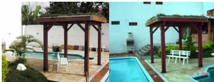
Figura: Ecotelhado para quiosques.

Fonte: Disponível em: < http://www.ecotelhado.com.br/casa.htm >.