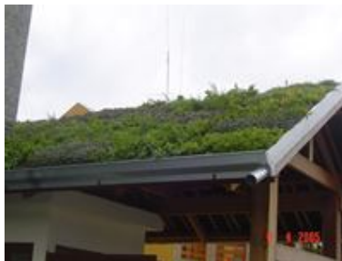
Figura 9: Montagem do telhado verde Fonte: Disponível em: < http://www.ecotelhado.com.br/montagem.htm >.

Seu telhado está pronto, proporcionando um visual agradável, um jardim suspenso purificando o ar que respiramos.