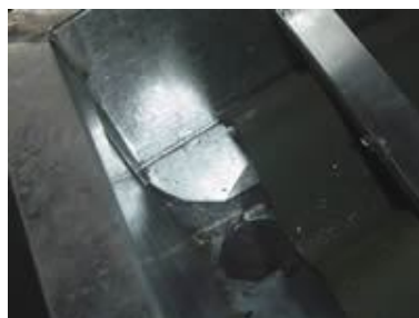
Figura 13: Vista do dreno da calha do ecotelhado

A ecotelha pode ser instalada ainda sobre qualquer tipo de telhado ou laje plana, desde que a estrutura permita.