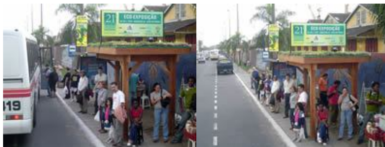
Figura: Ecotelhado em parada de ônibus.

As paradas de ônibus e bancas de revista podem ser transformadas em áreas verdes. Isto irá contribuir para o embelezamento, melhoria da qualidade do ar e biodiversidade nos centros urbanos.