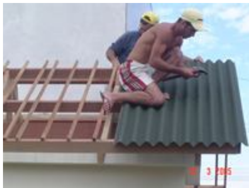
Figura 7: Montagem do telhado