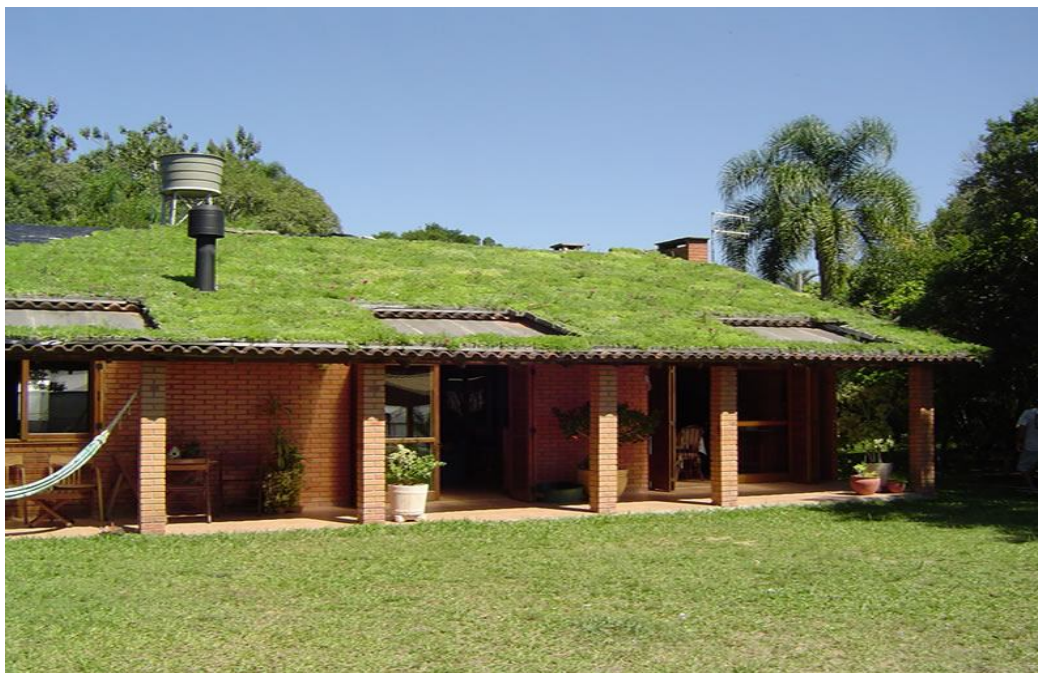
Figura 2: Telhado vivo