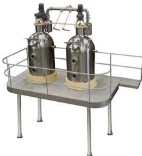
FIGURA 1- Concentrador a vácuo (Buller) com plataforma de operação Incal / Mod. JAA-220

A goiabada produzida industrialmente é obtida a partir da polpa de goiaba previamente processada com adição de açúcar e posterior concentração por aquecimento e evaporação. A mistura, constituída de 50 a 60% de polpa e o restante de açúcar, é concentrada em um tacho encamisado, até o teor de sólidos solúveis atingir 72°Brix. Produtos de melhor qualidade serão obtidos se forem usados concentradores a vácuo (MEDINA et al , 1978), como os mostrados nas imagens a seguir (FIG. 1 e FIG. 2).