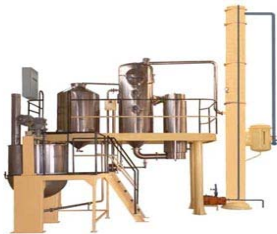
FIGURA 2 - Conjunto evaporador concentrador a vácuo multi-tubular Incal / Mod.JAA-INC-220-E