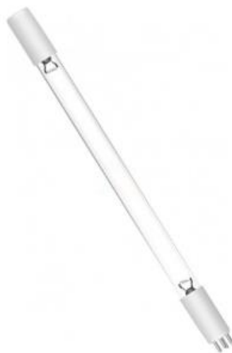
Figura 1 - Modelo de lâmpada ultravioleta para desinfecção e esterilização UV germicida 10W T5 185nm.

Para Chaves (2018), o crescente apelo por uma alimentação saudável tem gerado inúmeros desafios para a indústria alimentícia. Dentre estes desafios, a relação entre qualidade do alimento e o seu tempo de vida útil para consumo tem obrigado produtores e produtoras a buscarem tecnologias alternativas para o processamento de suas mercadorias, utilizando métodos mais eficientes para prolongar as propriedades naturais dos alimentos. Nesta perspectiva,