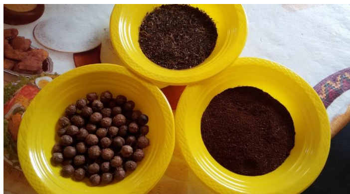
Figura 1- Semente de açaí

Açaí é o nome de duas espécies de palmeira, Euterpe precatoria (açaí-solteiro, Açaí-da-mata,) e Euterpe oleraceae (Açaí-de-touceira, açaí-verdadeiro) pertencentes a família Arecaceae cujo fruto produz uma polpa chamada “vinho” de açaí, de cor violeta e sabor forte. (INFOESCOLA, 2015)